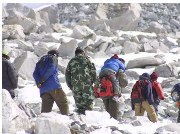
Soldats chinois escortant leurs prisonniers après la tuerie