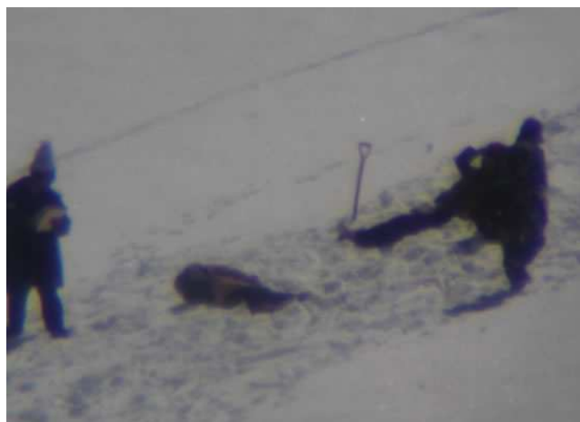
4 soldats chinois autour d'une victime

La manière dont les soldats chinois se débarrassent des corps en les jetant dans des crevasses permet aux autorités chinoises de ne pas compter ni officialiser le nombre de leurs victimes, et suffit à démontrer la barbarie avec laquelle ils continuent, aujourd'hui, de traiter le peuple tibétain !